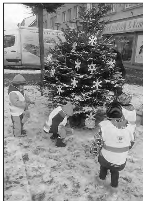
Kuřátka zdobí na náměstí stromček.