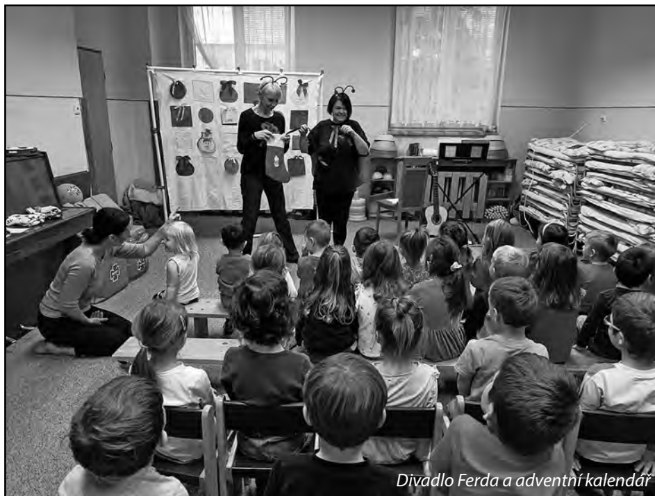
Divadlo Ferda a adventní kalendář

• A dál jsme „nadělovali“ i rodičům. Starší děti ze tříd Veverky a Sovičky nacystaly vánoční překvapení v podobě vystoupení pro rodiče. Vánoční koledy, písničky, básničky a pohádky... moc se jim to povedlo! Ručně vyrobené přání