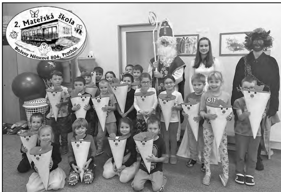
Mikulášská nadílka u Motýlků.

I když už jsme se všichni lehkým krokem přehoupli do nového roku, ještě se ohlédneme za dobou vánoční.