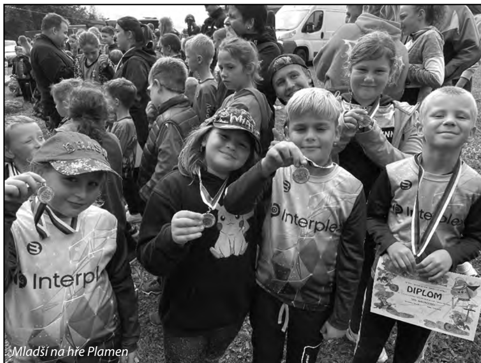
Mladší na hře Plamen