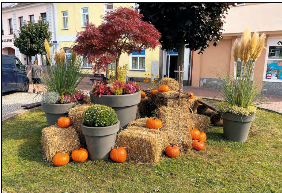
O nápaditou podzimní výzdobu města se postarala firma MELO. Děkujeme.