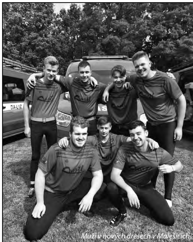
Muži v nových dresech v Malešicích

Poslední zářijovou sobotu se 11 dětí z mladých hasičů zúčastnilo hry Plamen. Plamen je soutěž, která má za cíl rozvoj dětských znalostí, vědomostí a dovedností s přihlédnutím k odborné technické oblasti požární ochrany, která se koná ve dvou kolech, podzimní a jarní. Naši mladí hasiči se této hře zúčastnili po několika letech, a pro všechny to byla nová zkušenost a zážitek. Tradičně se tato hra koná v Mozolově, ale