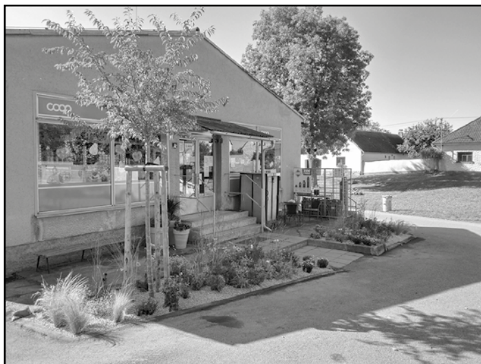
Prodejna COOP spolu s občany Krče děkují městu Protivín a zahradnictví MELO Protivín za krásnou květinovou výzdobu.