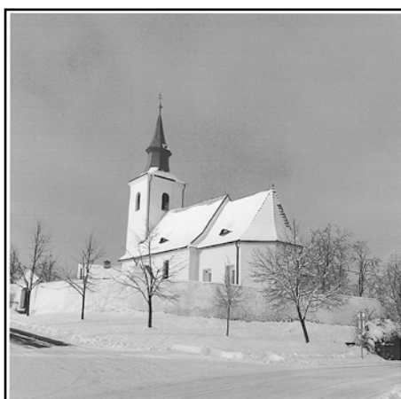
Římskokatolická farnost Heřmaň u Písku

Junák – český skaut, středisko Blanice Protivín