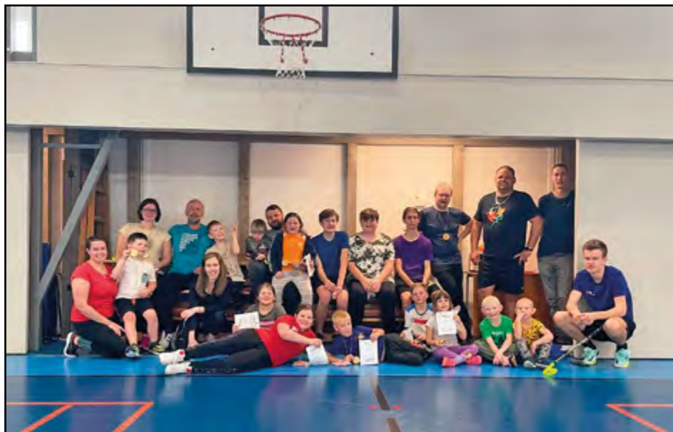
Poslední trénink ve sportovní hale

dobrym soupeřem pro ostatní týmy po celou soutěžní sezónu.