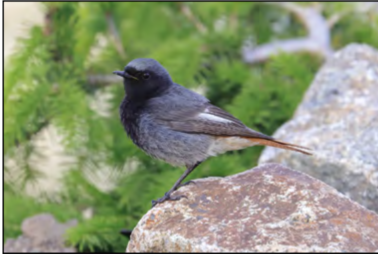
Kominiček v plné kráse – rehek domácí samec.

A jak tedy rehci těží z globálního oteplování planety? Začneme trochu zeširoka. Rehek domácí je původně vysokohorský druh žijící a hnízdící na skalách v nadmořských výškách nad hranicí lesa. Dodnes ho tak můžete vidět ve vysokých horách na Slovensku