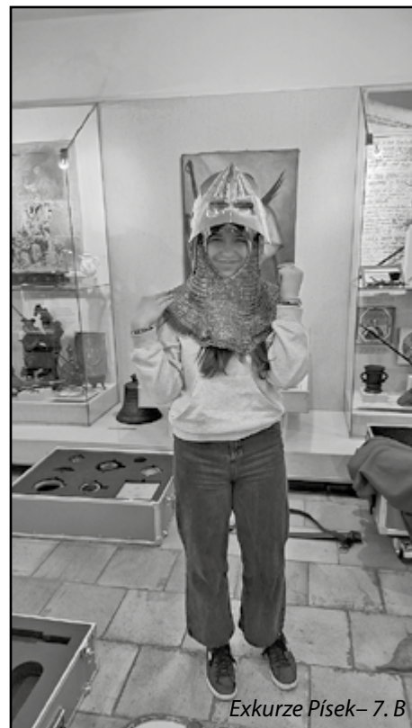
Exkurze Písek – 7. B