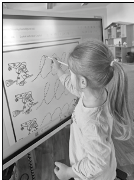
Grafomotorika na interaktivní tabuli

Spolek Svaz zdravotně postižených Protivín srdečně zve své členy