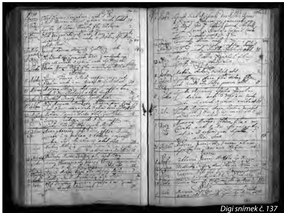
Digi snímek č. 137

Dne 11. 4. 1741 – Pohřbeni jsou v Myšenci dva vojáci od regimentu Hatziano Byrones, a Francouzi mrtví jsou, katolické víry z cizí země. Psaní uloží ve farnosti kapitán Sereni Comite. Poskytnuty na tom větru na cestě z... (nečitelné) (Snímek č. 137, https://digi.ceskearchivy.cz/6699/137 , první zápis vpravo).