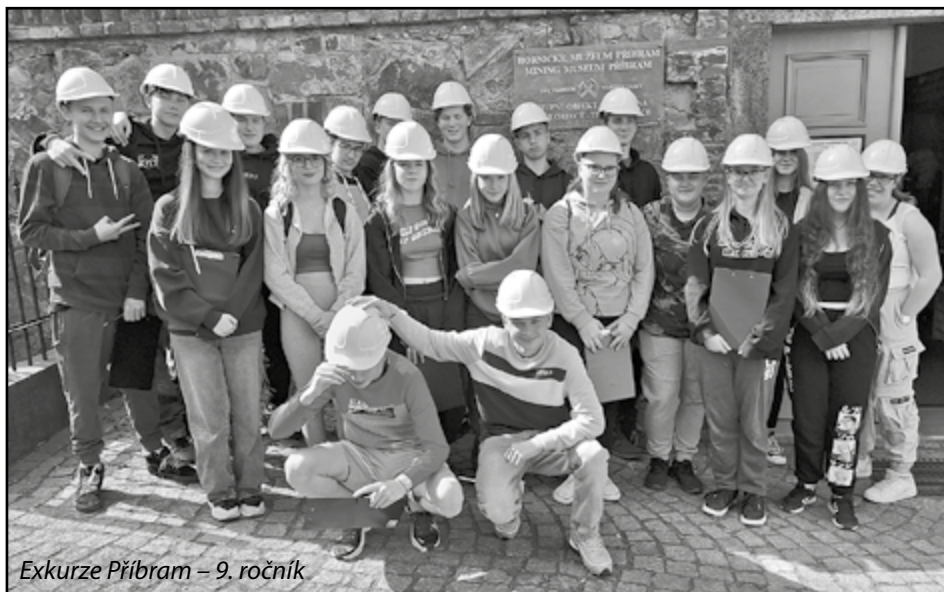
Exkurze Příbram – 9. ročník