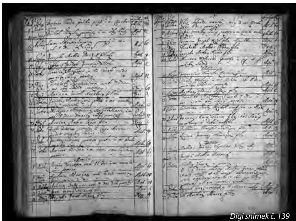
Digi snímek č. 139

Ze zápisu je patrné, že vojáci byli pohřbeni s určitou pietou. Francouzská vojska zimovala ke konci roku, a do jara 1742 na Novohradsku na panství Buguoyů. (Habsburská dynastie využívala služeb této francouzské šlechty, a dodnes jsou dochované stopy, ale i celé kulturní krajiny, a to především na Novohradsku a Libějovicku). Paradox – francouzská vojska úspěšně „vyžírala“ své bývalé francouzské přátele v Čechách. Po opuštění zimoviště zranění a vážně nemocní fran. vojáci byli ponecháni na usedlostech sedláků. Ti, co přežili, založili v místě rodiny a věnovali se řemeslům. Do této doby jsou zde potomci franc. Tetauerů (Tetour), Lombartů. Jedním z nich byl i protivínský pan inženýr