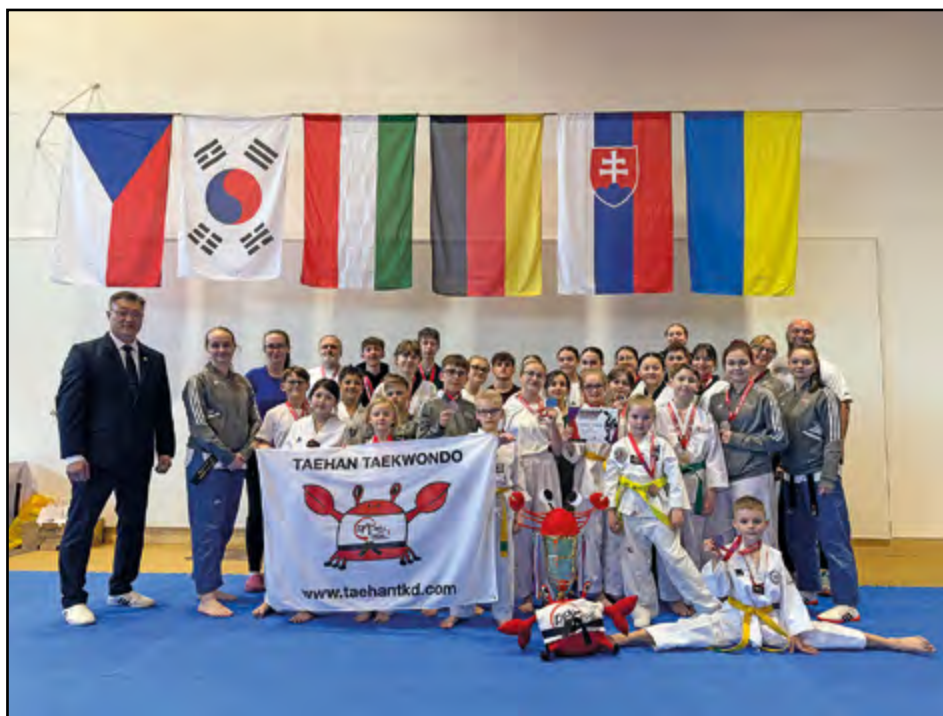
Taehan Kolín, Praha, Protivín