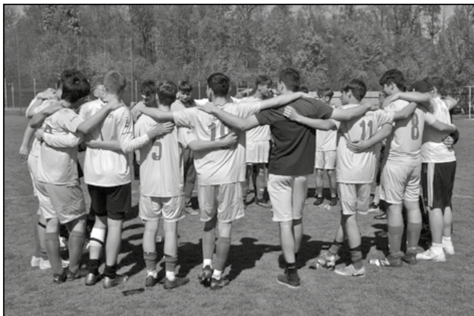
Vítězný pokřik po zápasu s Kestřany