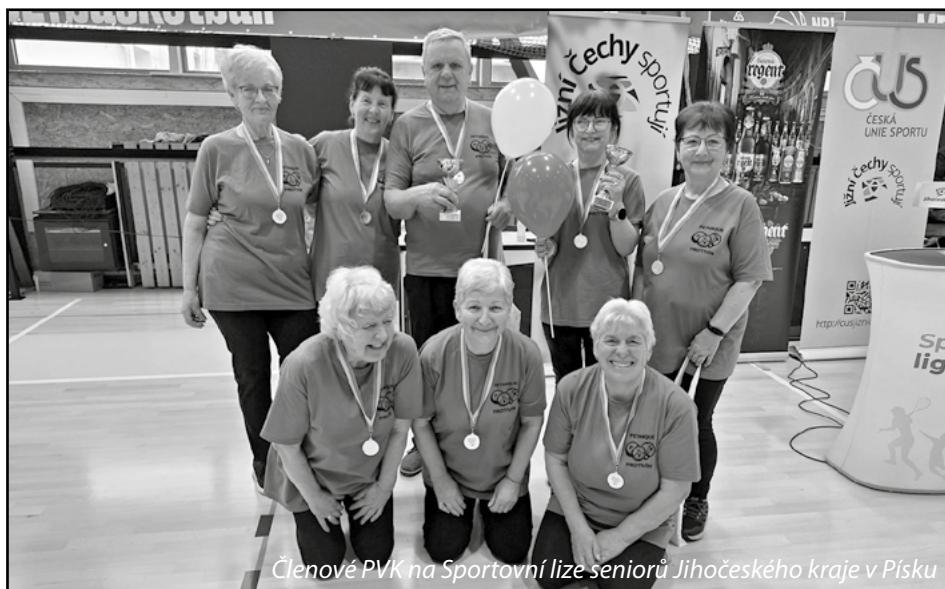
Členové PVK na Sportovní lize seniorů Jihočeského kraje v Písku

V úterý 30. dubna 2024 byl finálovým turnajem v Českých Budějovicích ukončen letošní ročník Sportovní ligy seniorů Jihočeského kraje. Postupně se podařilo uspořádat 20 turnajů ve všech okresních městech, do kterých se zapojilo 447 jihočeských senierek a seniorů. Soutěžilo se v pěti disciplínách: hod basketbalovým míčem na koš, běh s míčkem na raketě